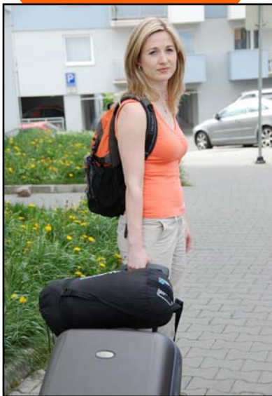
Obr. 1: Evakuace.

Evakuační zavazadlo a jeho obsah je v některých případech ohrožení to jediné, co Vám po opuštění domácnosti zůstane. Hasičský záchranný sbor LK ve spolupráci s Policií ČR – Krajské ředitelství Libereckého kraje Vám nabízí několik rad, jak by mělo evakuační zavazadlo vypadat a co by mělo obsahovat.