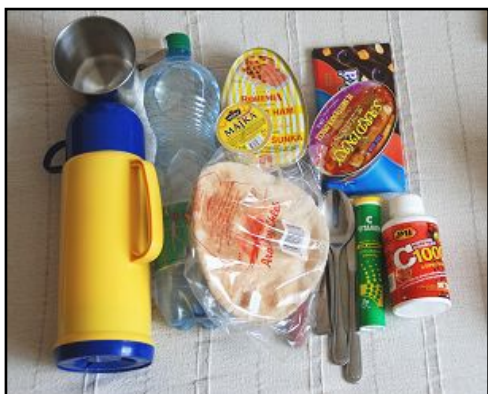
Obr. 3: Trvanlivé potraviny, pitná voda + nádobí.

Do první skupiny patří zejména trvanlivé a dobře zabalené potraviny, pitná voda (vše na 2-3 dny pro každého člena domácnosti), krmivo pro domácí zvíře, které berete s sebou, hrnek nebo miska, příbor a otvírák na konzervy . V případě, že máte individuální dietetický režim (např. bezlepková dieta, vegetariánství apod.), počítejte s tím, že v místech náhradního ubytování s hromadným zajištěním stravování bude možné Vám vyjít vstříc jen v omezené míře. Mějte tedy své speciální potraviny s sebou v dostatečném množství.