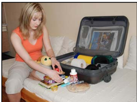
Obr. 7: Balení evakuačního zavazadla.

apod.), pokud Vám zbude místo, přibalte věci, které jste ochotni půjčit nebo věnovat jiným (potravin, oblečení, hračky...).