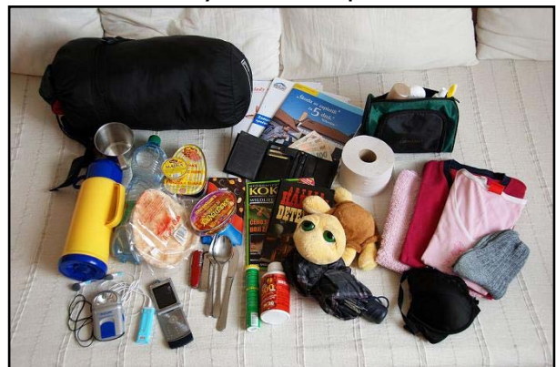
Obr. 2: Obsah evakuačního zavazadla.