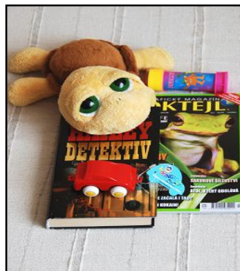
Obr. 6: Předměty pro vyplnění volného času.