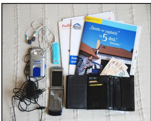
Obr. 4: Dokumenty, peníze, mobil + nabíječka, svítlna, MP3.

Do první skupiny patří zejména trvanlivé a dobře zabalené potraviny, pitná voda (vše na 2-3 dny pro každého člena domácnosti), krmivo pro domácí zvíře, které berete s sebou, hrnek nebo miska, příbor a otvírák na konzervy . V případě, že máte individuální dietetický režim (např. bezlepková dieta, vegetariánství apod.), počítejte s tím, že v místech náhradního ubytování s hromadným zajištěním stravování bude možné Vám vyjít vstříc jen v omezené míře. Mějte tedy své speciální potraviny s sebou v dostatečném množství.