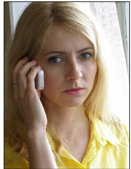
Obr. 2: Víte, co byste měli operátorovi sdělit?

Pokud zavoláte na špatné číslo, nic se neděje. Jednotlivé složky si volání předají mezi sebou. Jen budete muset třeba opakovat stejné informace, které jste již před chvílí říkali jinému operátorovi. To ale stojí drahocenný čas a záchranáři vyjedou později.