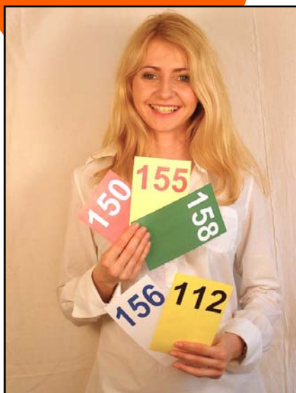
Obr. 1: Víte, které složce které číslo patří?

Každý z nás se může dostat do situace, kdy se stane svědkem nebo přímým účastníkem (v horším případě i postiženým) nějaké události, která ohrožuje naše zdraví, život, majetek nebo bezpečnost. Hasičský záchranný sbor LK ve spolupráci s Policií ČR – Krajské ředitelství Libereckého kraje Vám nabízí několik rad, jak se zachovat v okamžiku, kdy je třeba přivolat pomoc.